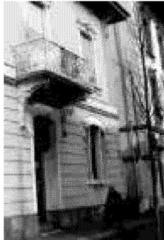
Le sede del Centro volontariato

Gli altri appuntamenti saranno il 17 maggio e il 14 giugno. Il primo sarà incentrato